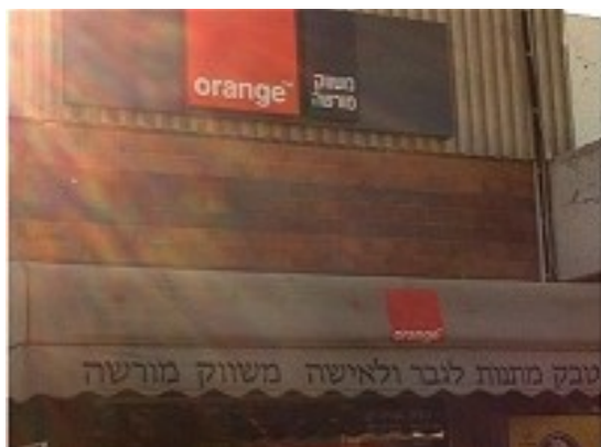
BOUTIQUE PARTNER ORANGE DANS LA COLONIE D'ARIEL

Or la colonisation est un obstacle majeur à la création de l'État palestinien et à une paix conforme au droit international.